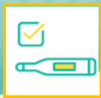
体温・体調 チェック