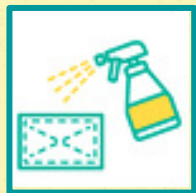
トイレ・座席 手すり等の消毒